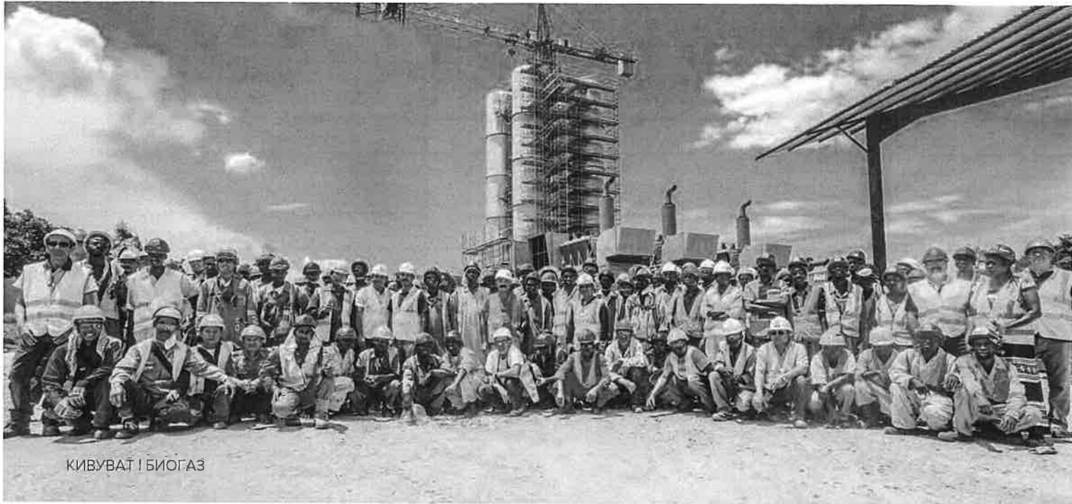
КИВУВАТ | БИОГАЗ